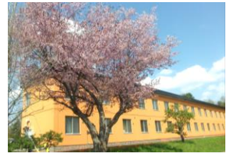
自然豊かで静かな環境です 定員 50名