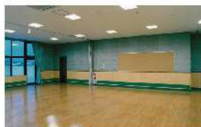
④⑰地域交流スペース