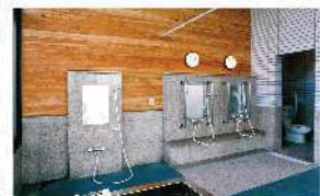
④㉑デイサービス/浴室