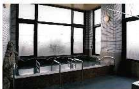
④㉑デイサービス/浴室